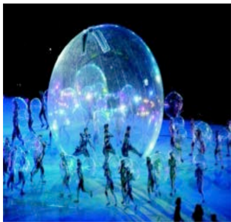
聽障奧運開幕大典