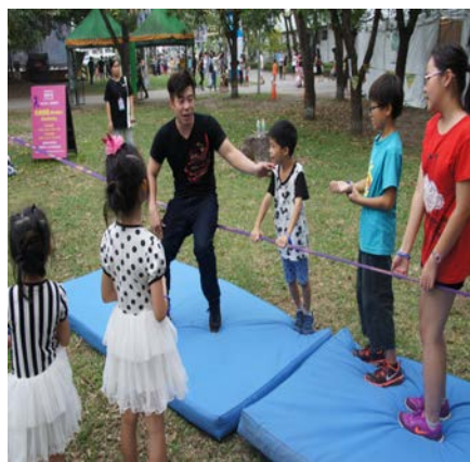
高雄衛武營馬戲藝術季