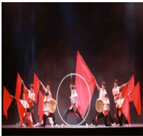
國際花博會四大園區駐演團隊