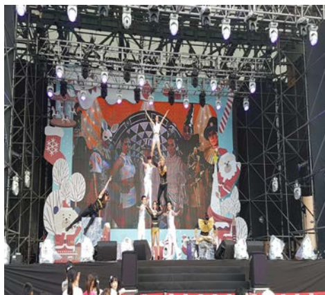
新北耶誕城大型演出