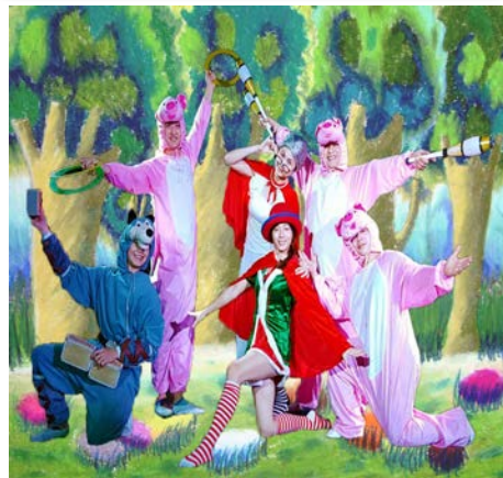
雙北兒童藝術演出團隊